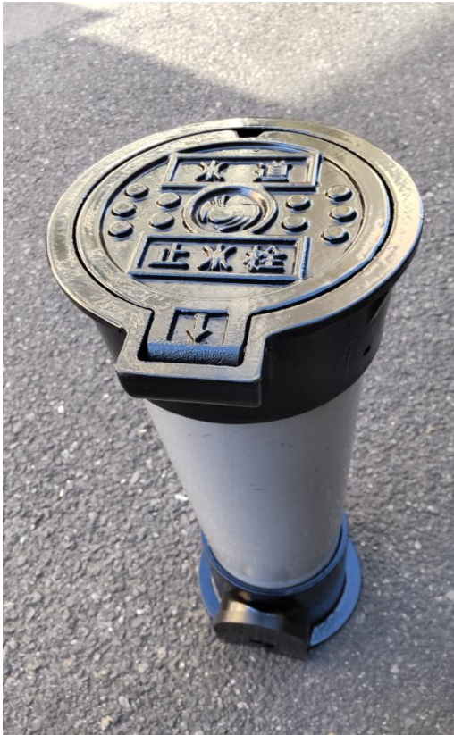
水道/止水栓文字 中央部 市章入り